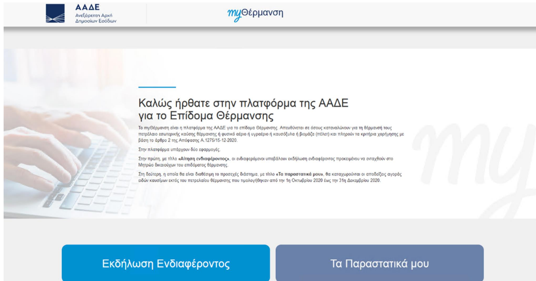
Εικόνα 1: Κεντρική Οθόνη

Από την κεντρική οθόνη της πλατφόρμας, επιλέγετε «Τα Παραστατικά μου».