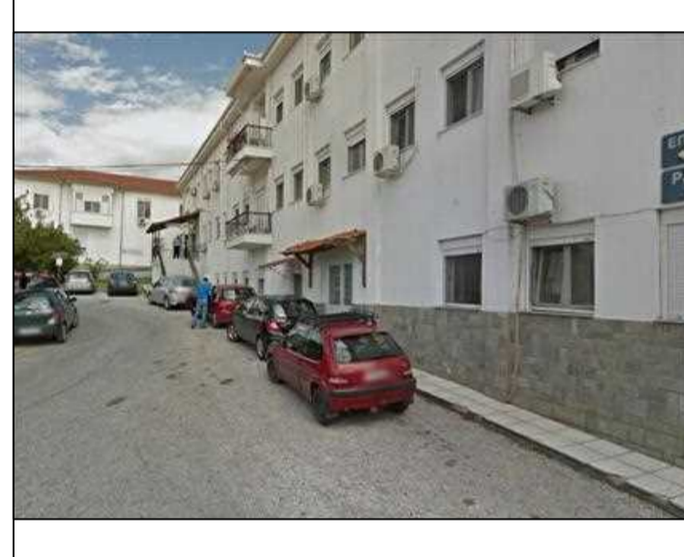
Φωτογραφία θέση 2