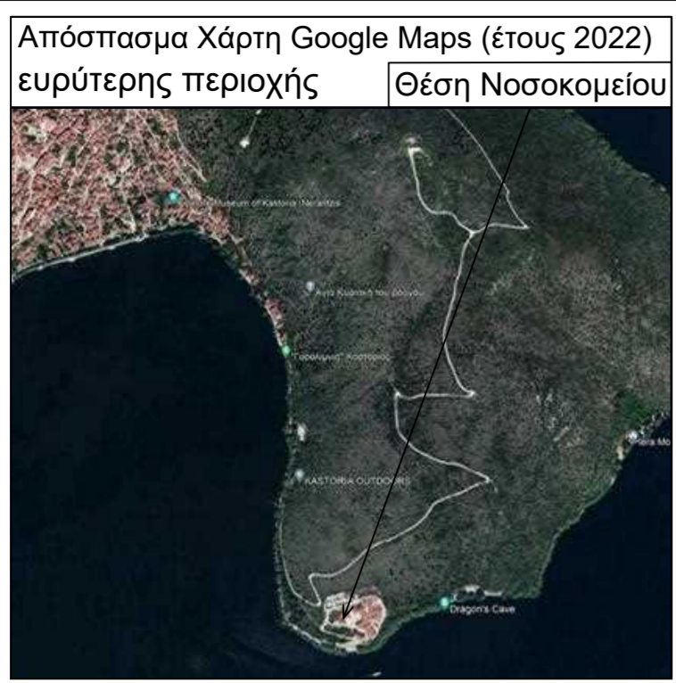
Φωτογραφία θέση 1