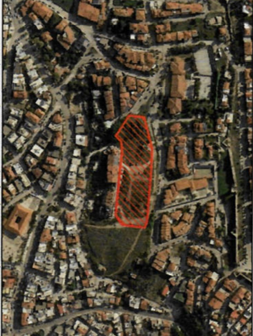
Οδοιπορικό σκαρίφημα - Θέση ακινήτου